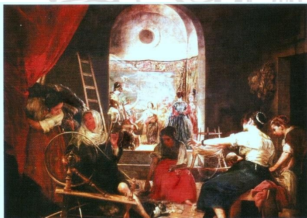
Las hilanderas de Diego Velázquez

18.- Leemos los diálogos de los chicos y los anotamos en nuestra carpeta aplicando estos signos: . (punto) ¡! (exclamación) ¿? (interrogación) según corresponda.