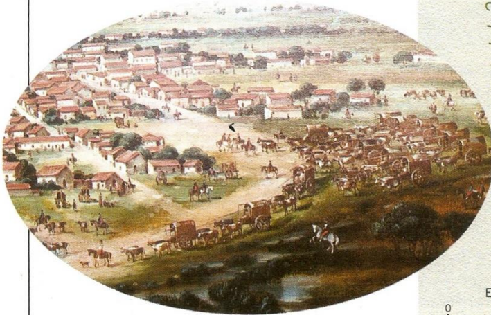
Transporte de vinos y mercaderías diversas hacia Potosí, según un cuadro de Léonie Matthis.

Las estancias de la zona del Litoral aumentaron su producción de mulas para Potosí y de vacunos, cuyos cueros eran exportados por Buenos Aires. La región menos beneficiada fue la de Cuyo (Mendoza, San Juan, San Luis), pues sus vinos, aguardientes y aceites no podían competir con los que se importaban desde Buenos Aires. Para controlar mejor sus riquezas, el virreinato fue dividido internamente en ocho intendencias y cinco gobernaciones.