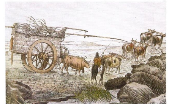
Por el territorio del virreinato, las mercaderías eran transportadas en carretas.