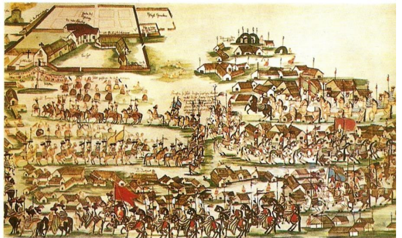
Procesión religiosa en la misión jesuítica de San Javier, Santa Fe, en 1752. Acuarela de Florián Paucke.

“Que la Luz del Divino Maestro llegue a todos los niños”