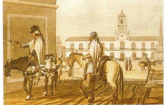
En Buenos Aires, desde el arco central de la Recova, se podía ver la Plaza Mayor y el Cabildo.

La ciudad de Buenos Aires pasó a ser entonces la capital del nuevo virreinato, y su puerto fue habilitado para comerciar directamente con España.