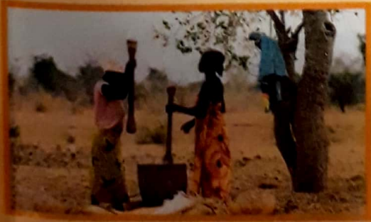
Agricultura en África.

Este proceso varía según las necesidades, los conocimientos y la capacidad tecnológica que tenga cada sociedad, así como en función de las posibilidades económicas de cada momento histórico. Por ejemplo, mientras que en algunos lugares se cultiva la tierra en forma rudimentaria, con arados primitivos y fuerza humana, en otros, el laboreo es mecanizado, rápido y sumamente eficiente.