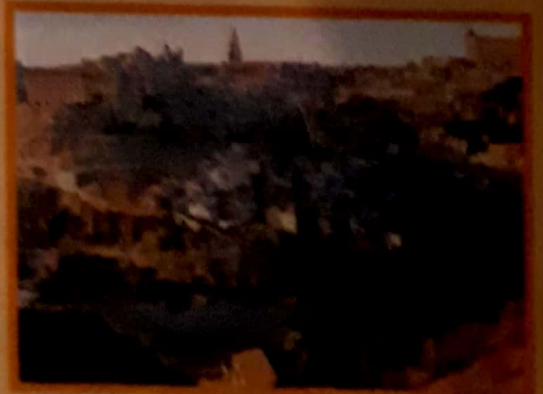
Vista de Toledo.

Los puentes y caminos, las represas en los ríos y las zonas cultivadas son elementos del espacio geográfico.