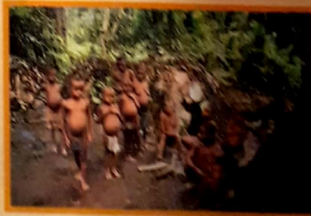
Los pigmeos viven actualmente en algunas selvas de África, sureste de Asia y Oceanía.