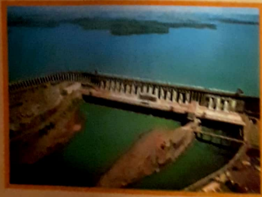
Central hidroeléctrica de Itaipú.