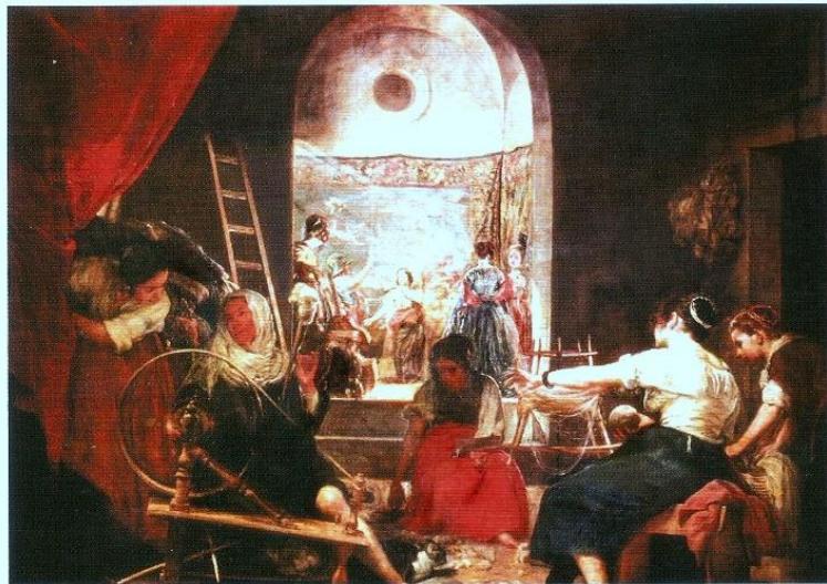
Las hilanderas de Diego Velázquez